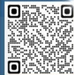
แบบฟอร์ม ก ข ค ง

5 กวดขันดูแลมิให้ข้าราชการตำรวจเข้าไปพัวพันเกี่ยวข้องกับยาเสพติด หากฝ่าฝืน ให้ดำเนินการโดยเด็ดขาด