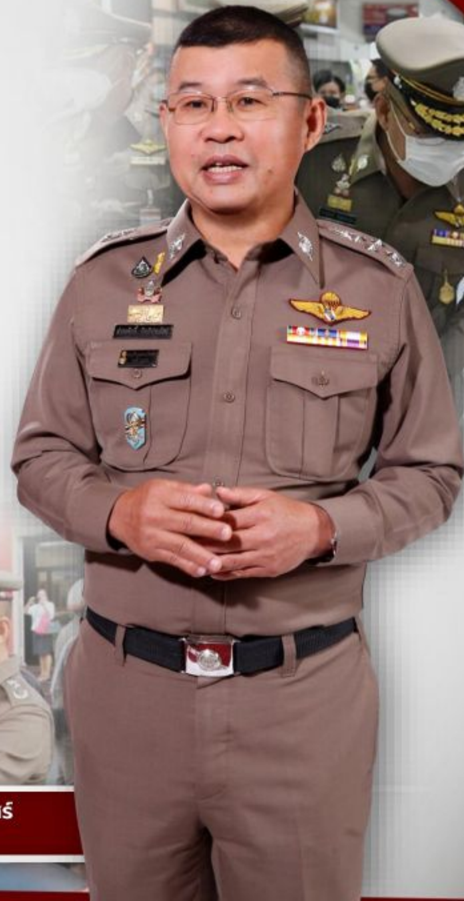
พลตำรวจเอก ดำรงศักดิ์ กิตติประภัสร์ ผู้บัญชาการตำรวจแห่งชาติ