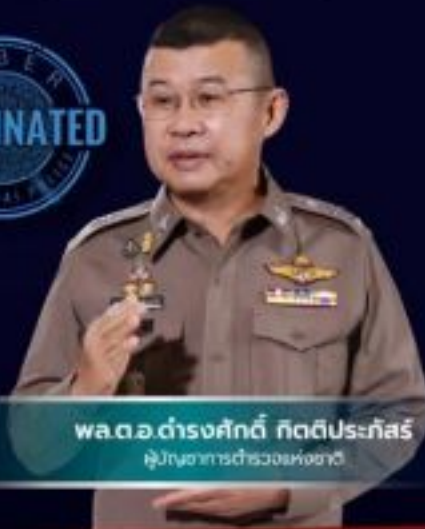
พล.ต.อ.ดำรงศักดิ์ กิตติประภัสร์ ผู้บัญชาการตำรวจแห่งชาติ