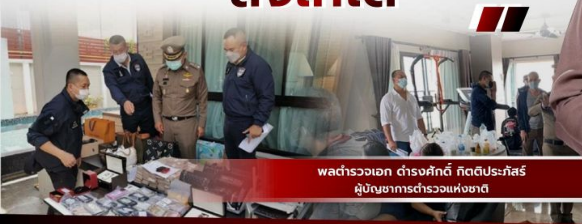
พลตำรวจเอก ดำรงศักดิ์ กิตติประภัสร์ ผู้บัญชาการตำรวจแห่งชาติ

ต้องลดสถิติ คดีอาชญากรรม ทางเทคโนโลยี ลงให้ได้